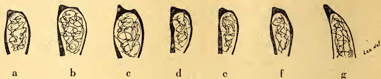
Fig. 1: Penisspitze (Dorsalansicht) von a) Leistus Apfelbecki Apfelbecki Gg., b) L. Apfelbecki imitator Breit., c) L. ucrainicus n. sp., d) L. Noesskei Bänn., e) L. glacialis Fiori., f) L. gracilis Fuss., g) L. (Leistophorus Reitt.) ovipennis Chaud.

weniger asymmetrisch und am Ende ziemlich breit abgestutzt. (Siehe Fig. 1). Der Präputialsack zeigt keine ausgeprägten Chitinisierungen,